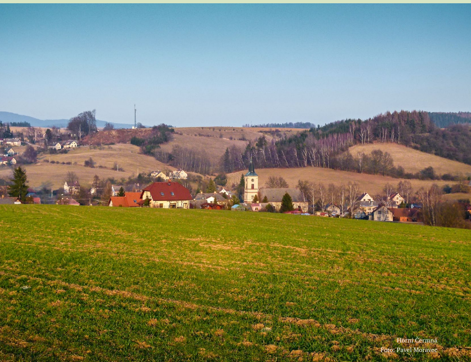
Horní Čermná